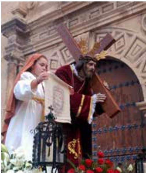
Procesión de Nuestro Padre Jesús y Virgen de los Dolores, en la Semana Santa de 2017