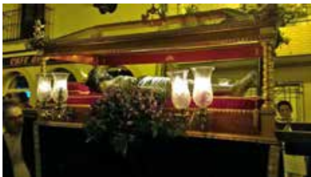
Procesión de El Amarrao, el Santo Entierro y Nuestro Padre Jesús 2017