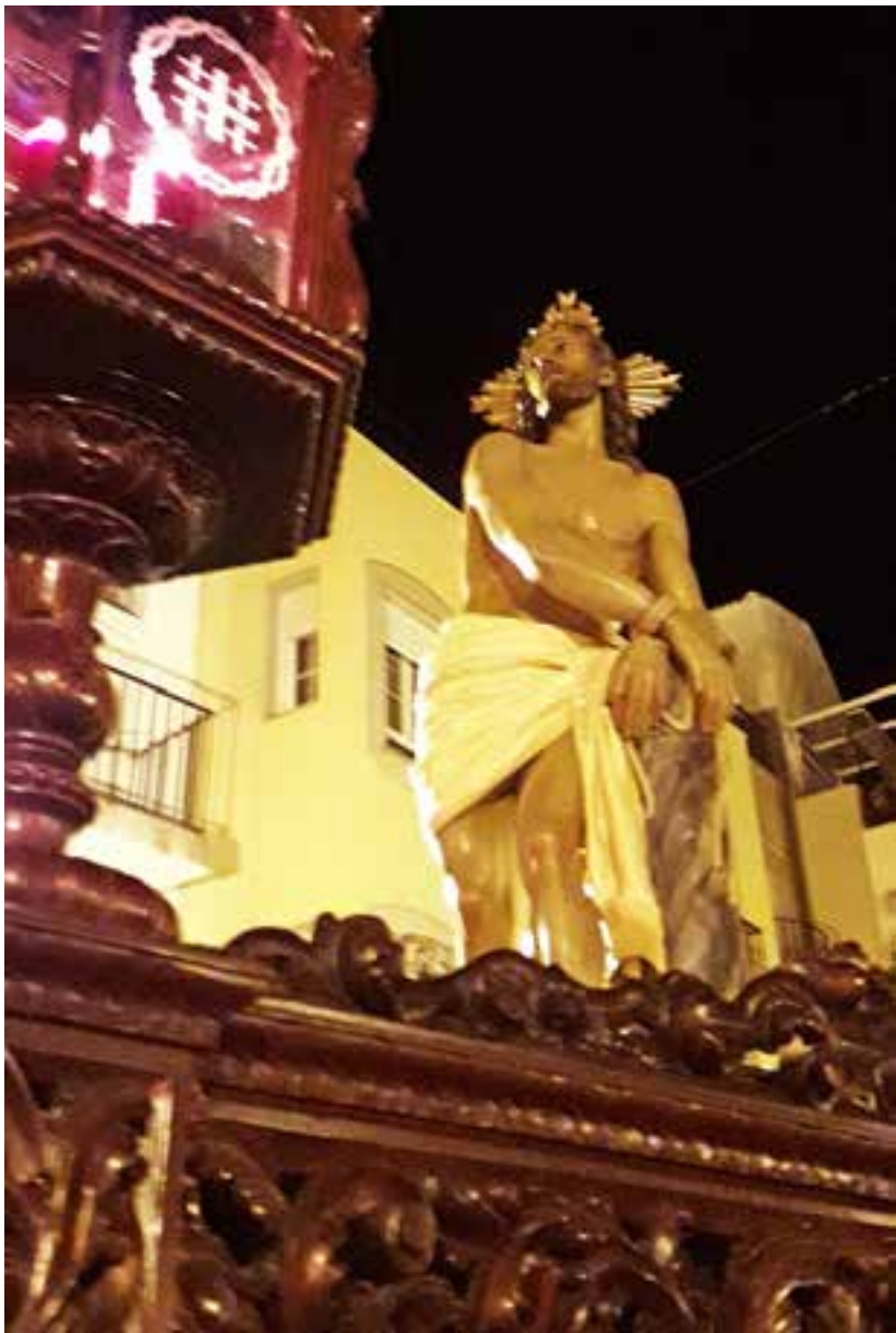
El Amarrao, procesionando por las calles de Bedmar en la Semana Santa de 2017.